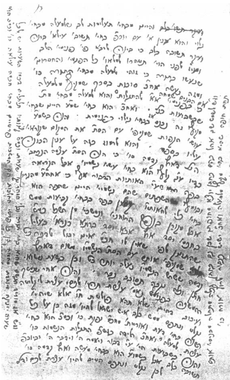
צילום גוכתי"ק הצ"צ – סיום ד"ה ביום השמע"צ